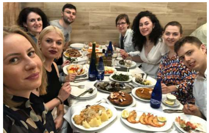
Abendessen nach dem Workshop

Wir halten euch auf dem Laufenden, was weitere regionale Schritte angeht!