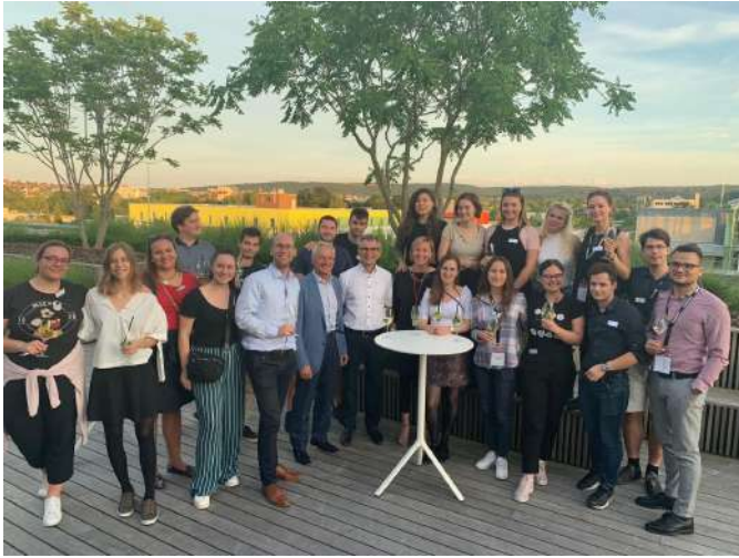
Teilnehmer der Leadership Summer School und die Organisatoren

Anfangs August hat die zweite Leadership Summer School in Stuttgart stattgefunden. Die 18 Master-Studenten mit Unternehmer- und Führungsambitionen, kamen aus 10 Ländern: Rumänien, Slowakei, Bosnien, Slowenien, Tschechien, Ungarn, Republik Moldau, Estland, Bulgarien und Serbien. Das Programm wurde mit einem Get-Together am Sonntagabend eröffnet.