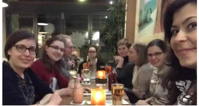
Teilnehmer der Sitzung