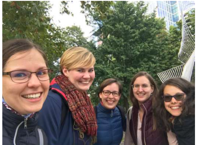
Participants of the meeting