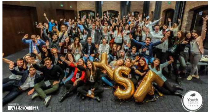
Teilnehmer des YouthSpeak Forums