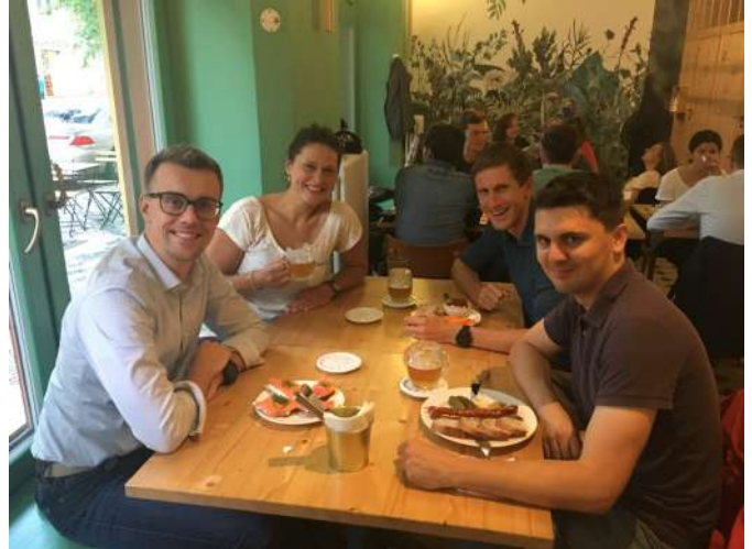
Mummert Alumni aus Prag