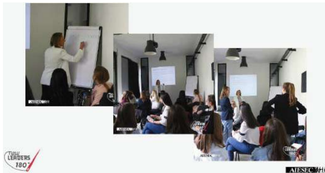
Teilnehmer der Konferenz

New Leaders ist ein Projekt von AIESEC Serbien, das seit 2006 durchgeführt wird und junge Führungskräfte aus dem ganzen Land zusammen bringt, um denen die Möglichkeit zu geben sich persönlich auszutauschen.