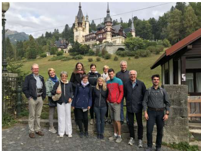
Teilnehmer der Entdeckungsreise in Siebenbürgen

Die Entdeckungsreise hat im Anschluss an das Herbstseminar stattgefunden. Sie ermöglichte denjenigen Teilnehmern, die mehr Zeit in Rumänien verbringen möchten, mit eigenen Augen das Land zu erkunden, das Leben der Einheimischen kennenzulernen, die Natur zu erleben und in die lokale Geschichte einzutauchen.