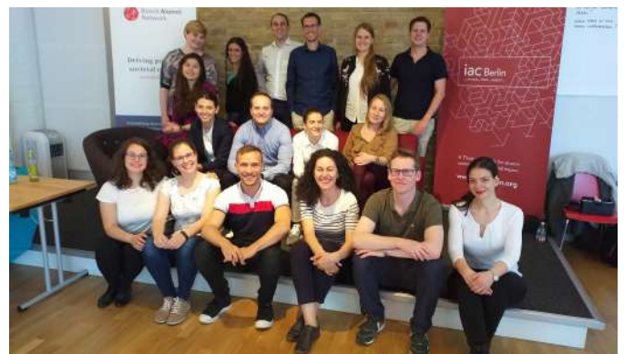
Teilnehmer des Strategie-Workshops